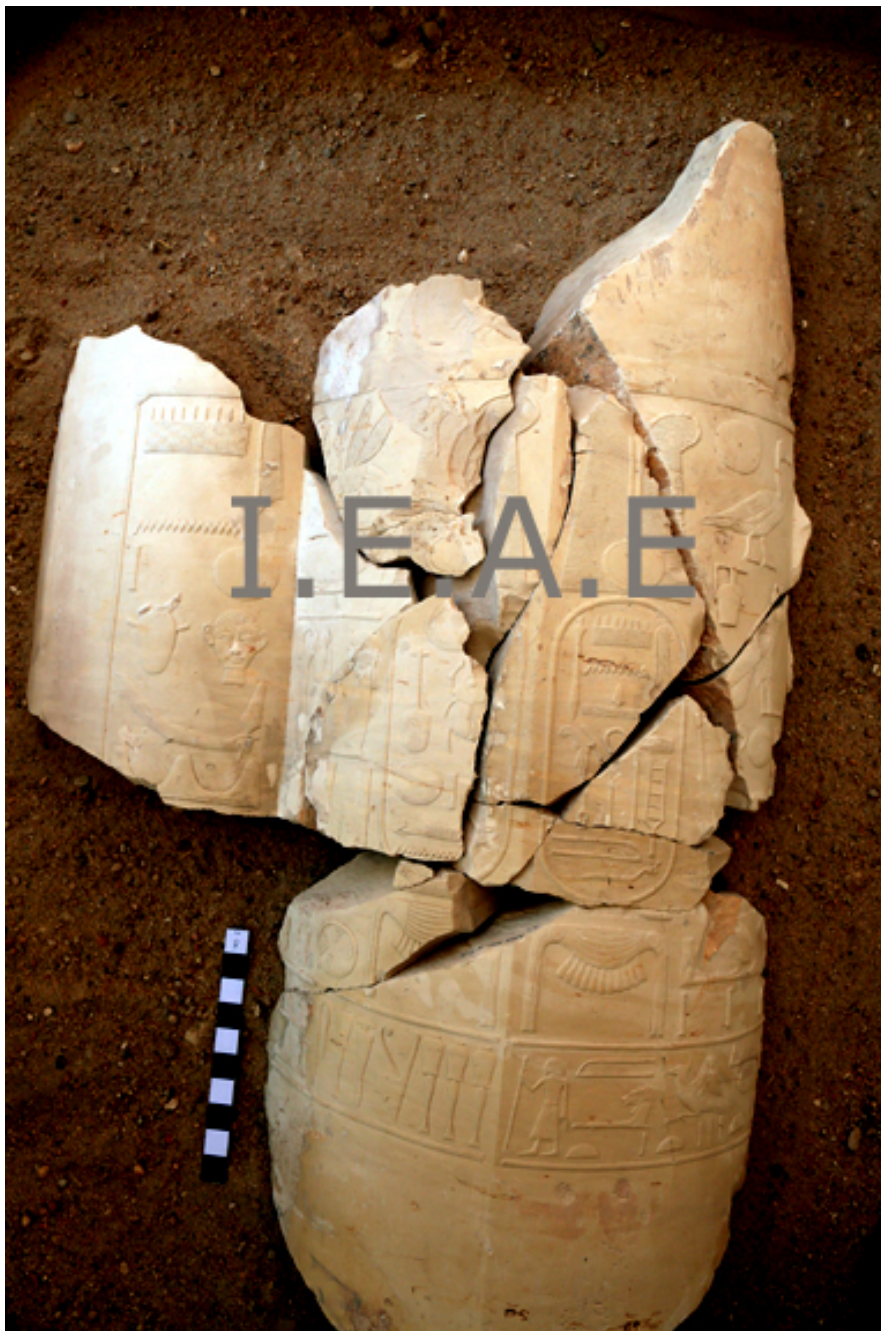
Fragmento de columna con el nombre de Amen-Hotep IV. Dinastía XVIII. (1358-1355 B. C.)