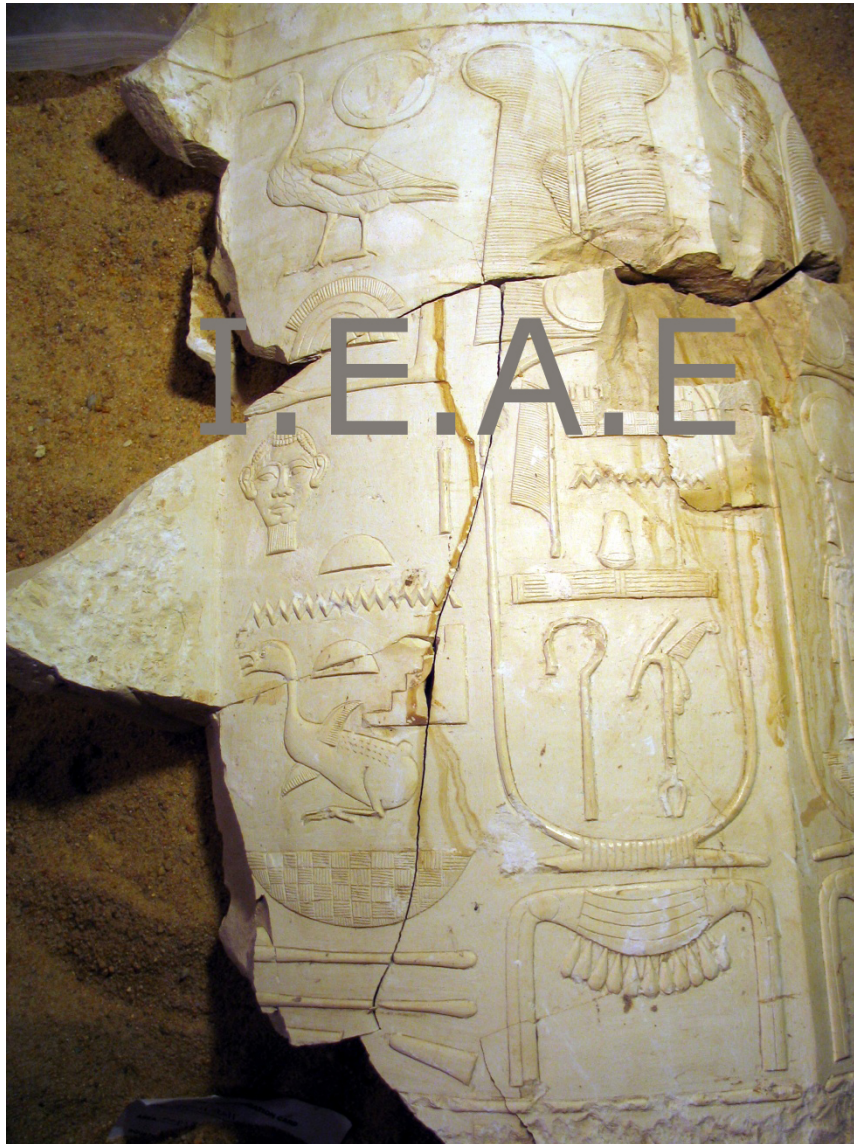
Fragmento de columna con el nombre de Amen-Hotep III. Dinastía XVIII (1358-1355 B. C.)

Proviene: Tumba del Visir Amen-Hotep Huy -nº-28- at Asasif (Luxor). Descubierto por la Misión Arqueológica Española Proyecto Visir Amen- Hotep Huy del Instituto de Estudios del Antiguo Egipto de Madrid. España.